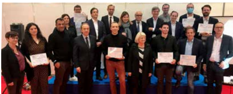
Les lauréats 2022